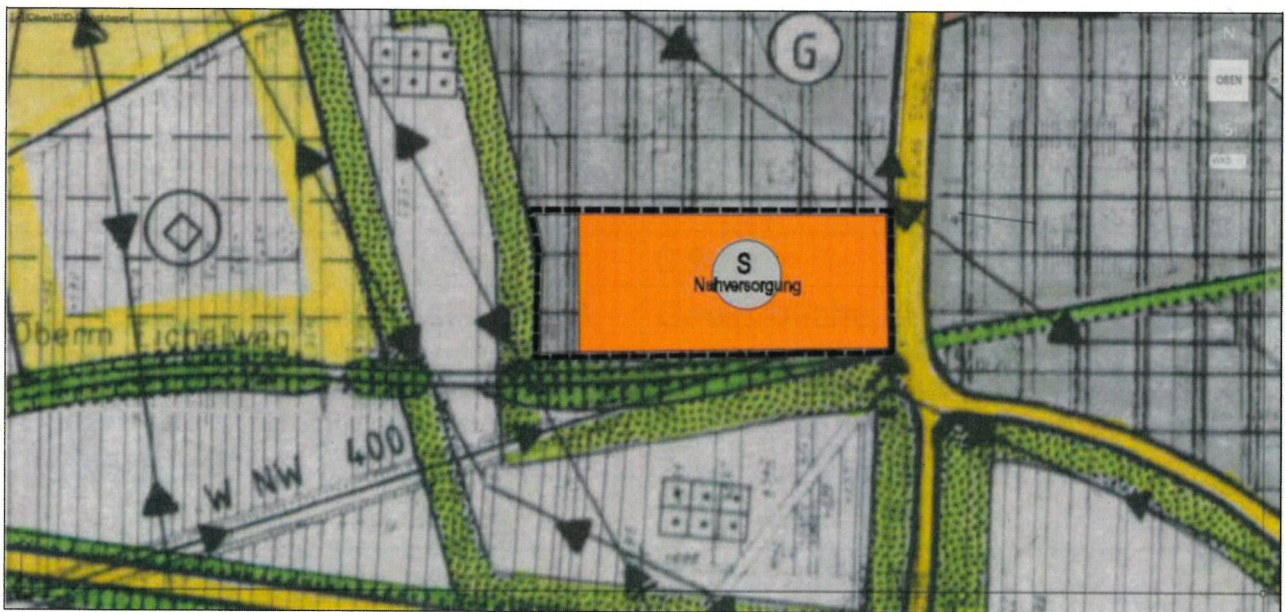
Künftige Darstellung im Flächennutzungsplan