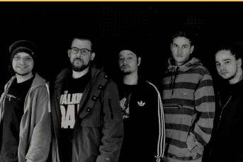
Lookey, Julezmann und Gute Gesellschaft